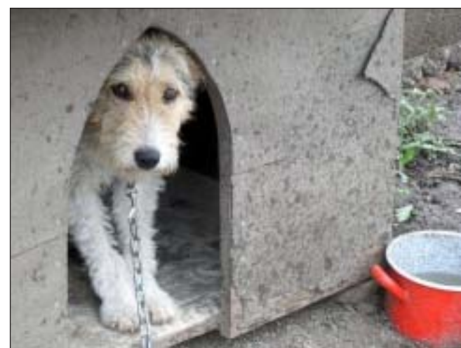
Ez a kutyus is az állatotthon lakója volt, de már van új gazdija

– A kutyusok így azonban nem az utcán, nem a sintérlapen végzik, hanem menedéket lelnek otthonukban.