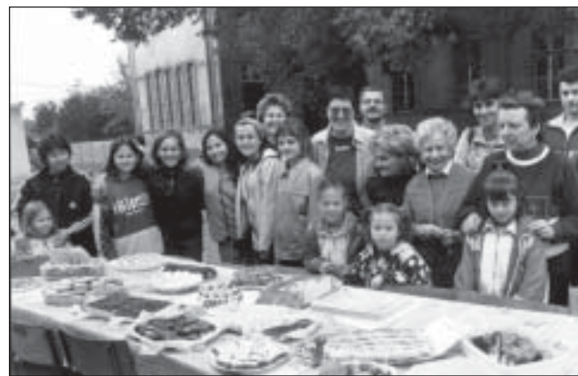
A legnagyobb sikert talán a sütemények aratták

Eközben készült a paprikás krumpli, amit a tombola-sorsolást követően jóízűen ettek meg résztvevők, a hosszú, terített asztaloknál. A résztvevők nagyon jól érezték magukat és mindenki úgy köszönt el egymástól, hogy ezt a sikeres napot tavasszal ismételni kellene. – ic