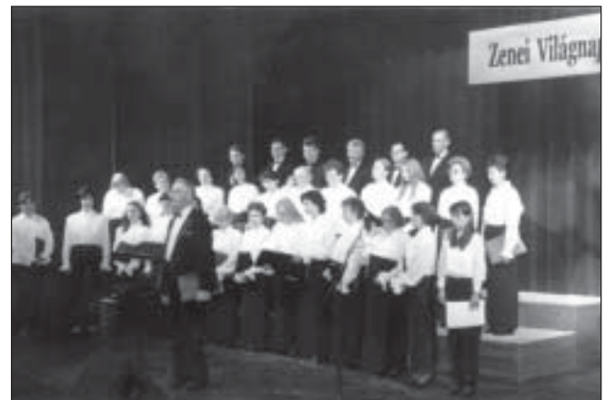
A másik kitüntetett: az Erkel Ferenc Vegyes Kar