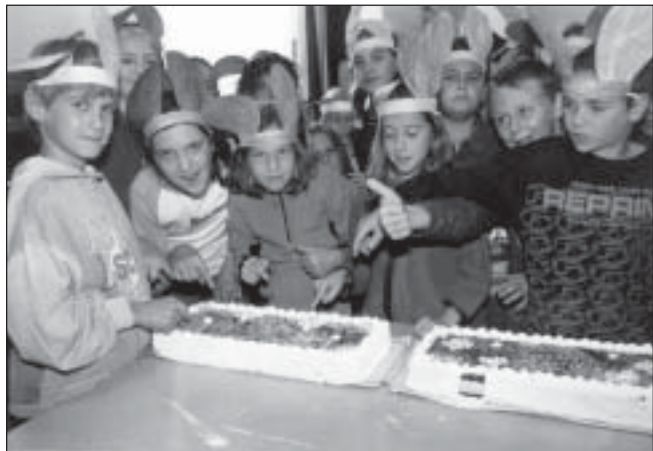
Még zöld fülel...

mindenki remekül bánt a labdával, a hulahopp karikával, a rejtvények, a becenevek sem okoztak nehézséget. Még az osztályfőnökök is fej-fej mellett teljesítettek, amikor is hurkapálca segítségével kockacukorból várat építettek. Így aztán az eredmény egy pillanatra sem volt kérdéses, mindkét osztály sikeres vizsgát tett, s jóízűen fogyasztották el az ezért járó tortát. – b