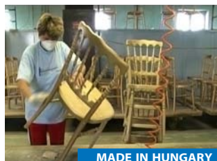
MADE IN HUNGARY