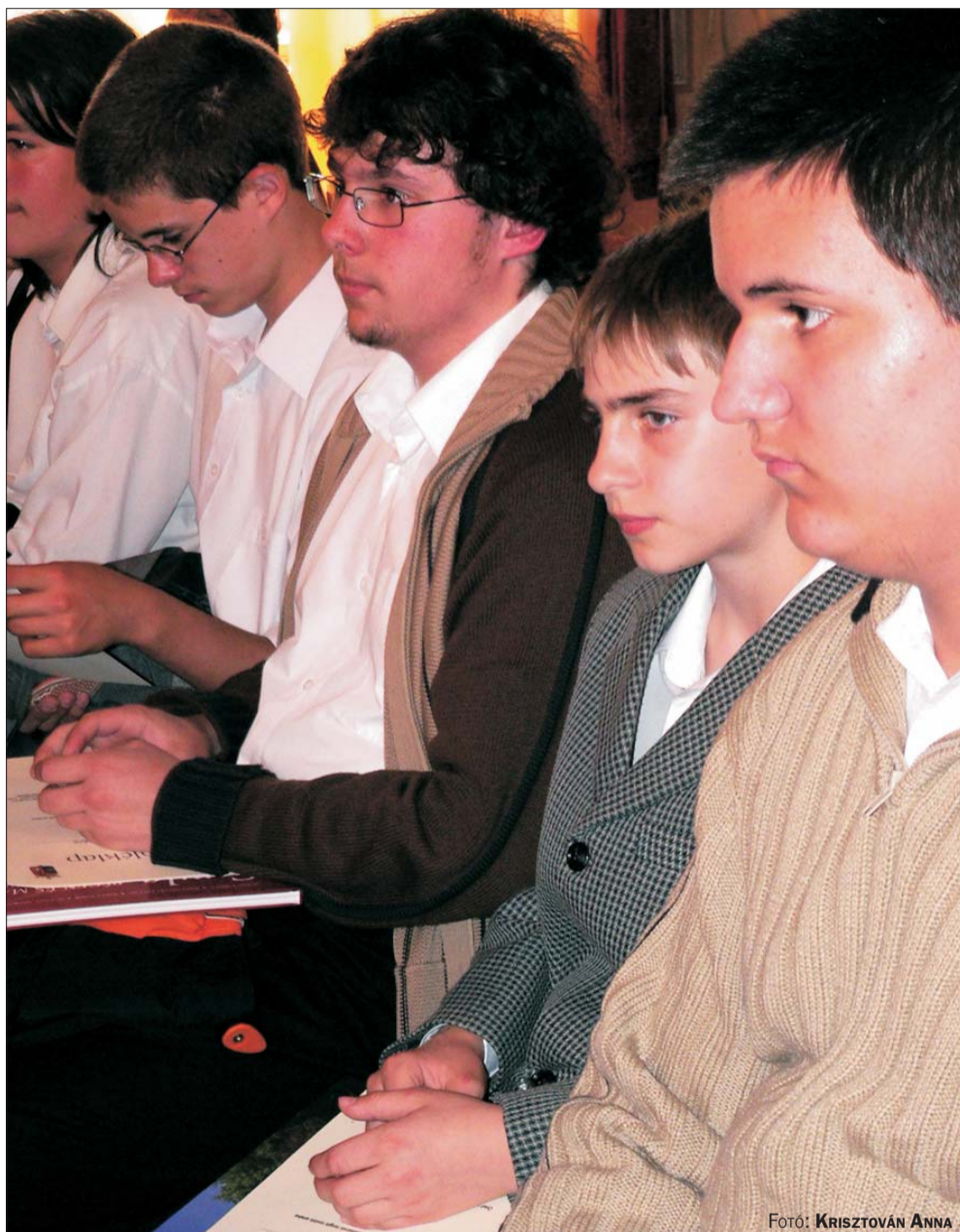
Fotó: KRISZTOVÁN ANNA

A Gyulai Városbarátok Köre a virtuális világban is „beerősített”. A szervezet nemrégiben mutatta be honlapját. A www.varosbaratok.hu több mint egy egyszerű egyesületi website. A lapon városunk történetéről, neves gyulaiakról is olvashatunk. Természetesen az egyesület eddigi tevékenysége is elénk tárul a világhálón. A városbarát programra azonban a látogatóknak még várniuk kell, a vezérlőfültre kattintva az oldal feltöltés alatt üzenet jelenik meg. (p-)