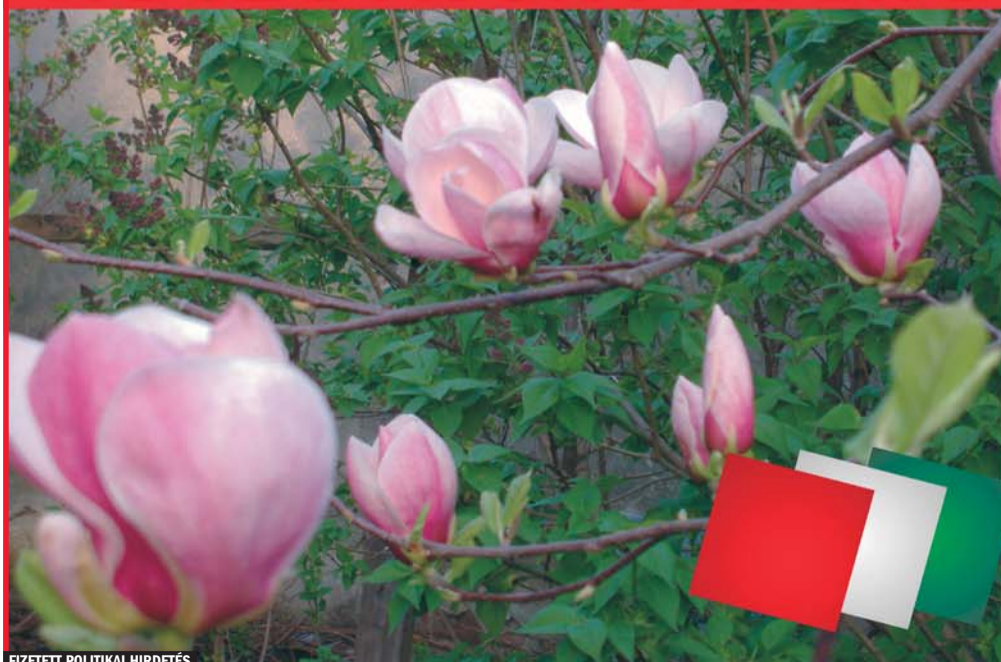
FIZETETT POLITIKAI HIRDETÉS