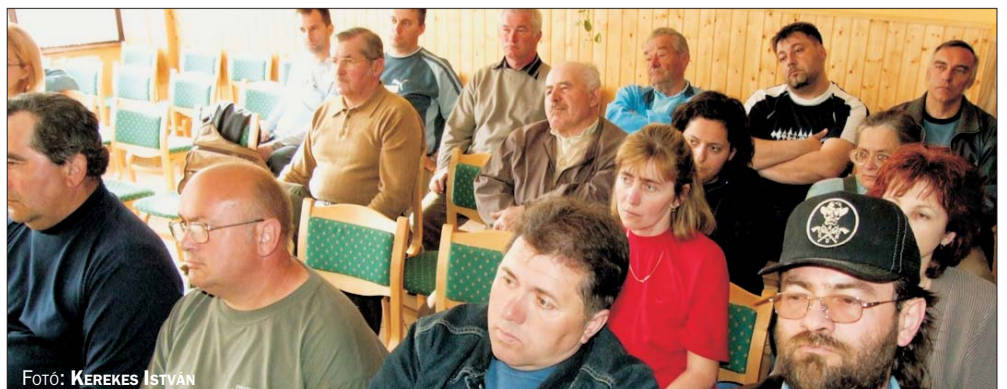
Felhívták a lakosok figyelmét arra, emésztőiket ne kössék be az új rendszerbe