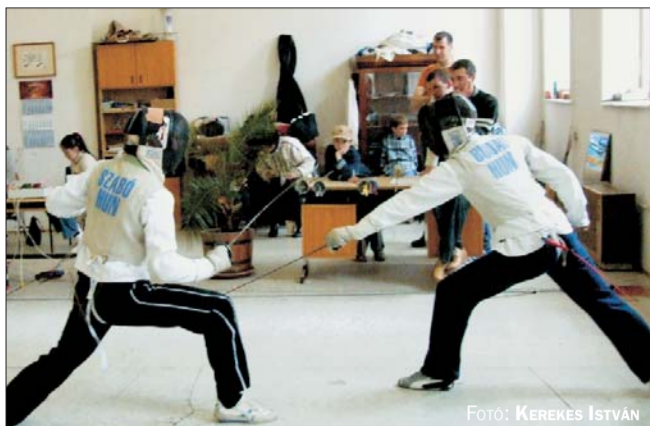
FOTÓ: KERÉKES ISTVÁN