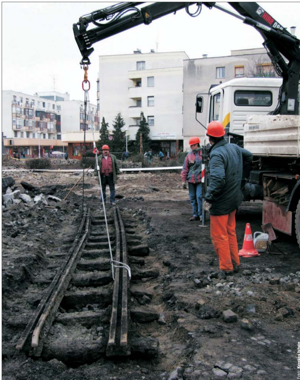
A Kossuth téren folyó építési munkák során a kisvasút nyomvonalából került elő egy több mint 8 méter hosszú sínpár. A „lelet” restaurálás után turisztikai látványossággént visszakerül a térre (Részletek a 4. oldalon)