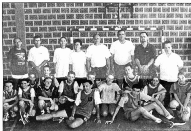
Képünk a tanárok és diákok kosárlabda-mérkőzése előtt készült