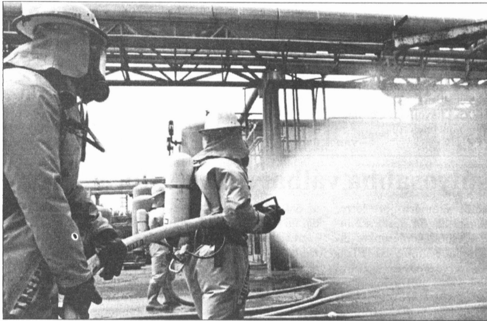
A tűzoltók precízen, gyorsan végezték dolgukat