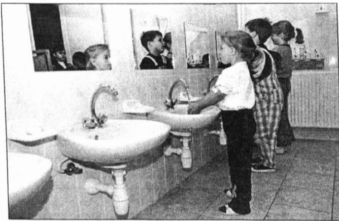
Ovisok az egyik új mosdóban