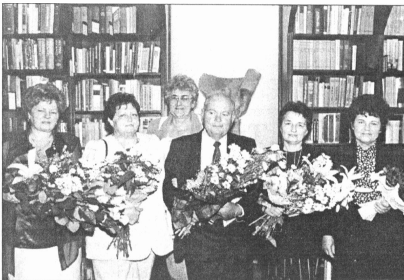
Az elismerésben részesültek

Az ünnepségen a város pedagógusait a Széchenyi utcai óvodások és az 5. számú iskola diákjai köszöntötték rövid műsorukkal. Programon kívül – meglepetésként – az Erkel gimnázium kórusának egy csoportja is fellépett. – van