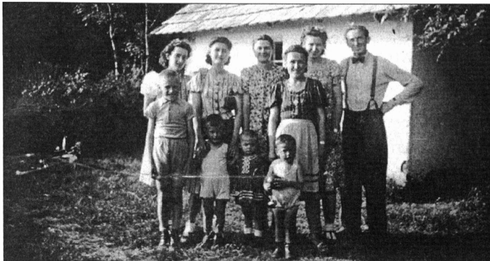
Városerdő már a II. világháború előtt is kedvelt kirándulóhelye volt a gyulai családoknak. Az itt közölt kép – mely 1939-ben készült az üdülőhelyen – is ezt bizonyítja