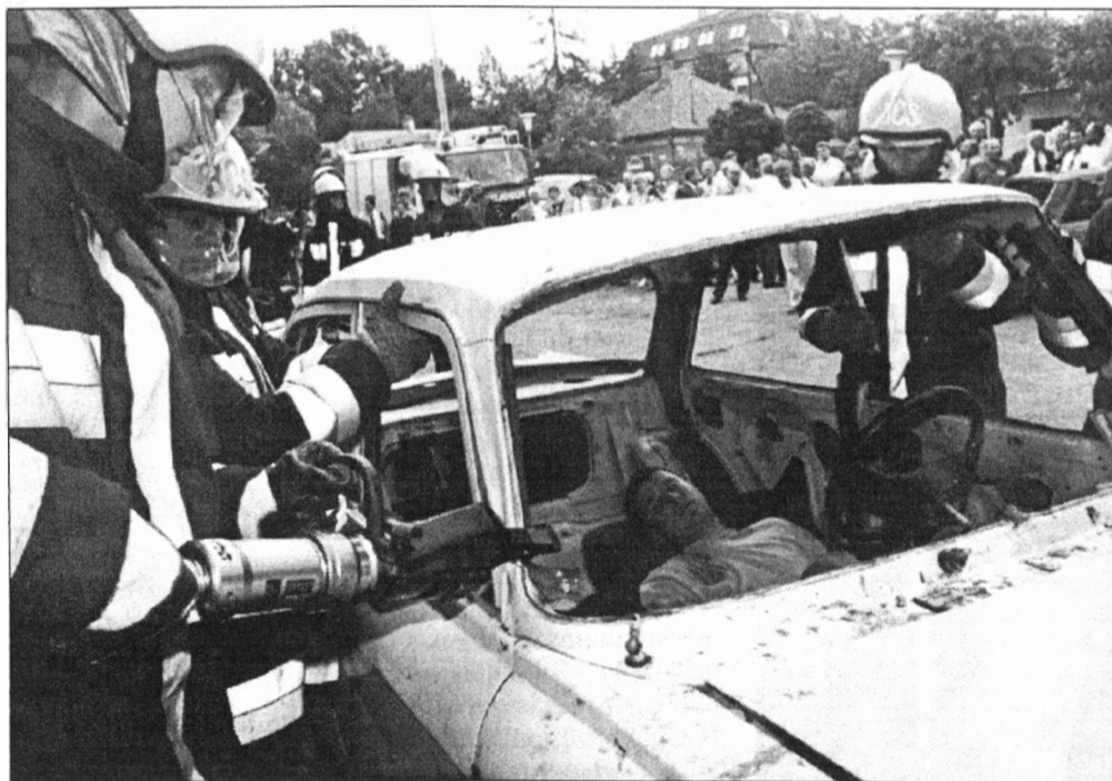
A csabai tűzoltók a „sérült” kiszabadításán dolgoznak

Jövőre a tervek szerint Félixfürdőn folytatják a szakemberek az eszmecserét. (-ván)