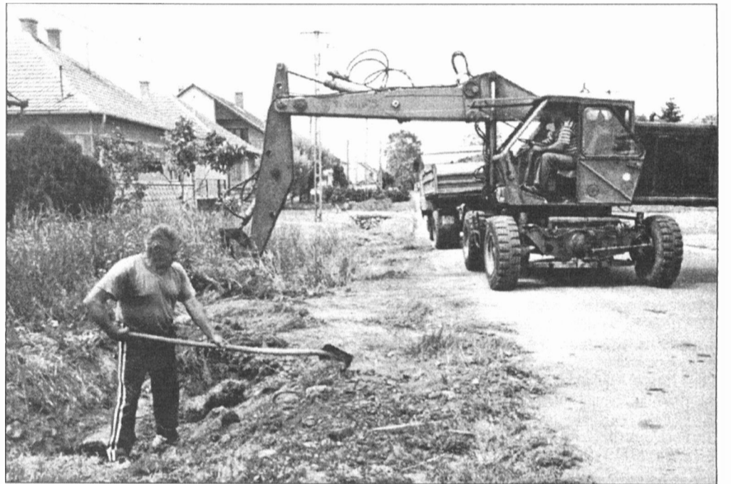
A Városgazdálkodási Igazgatóság szakemberei a közelmúltban a Rákóczi utcában „feltárták” az elhanyagolt csapadékvíz-levető árkokat