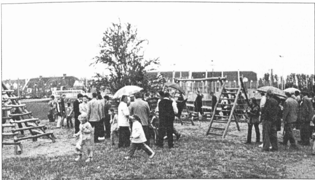
A Gyönygyvirág téri szabadidőpark ünnepélyes avatására a mostoha idő miatt ugyan meglehetősen rossz körülmények között került sor, ám a lakótelepi gyerekek örömmel vették birtokukba azt. Tudósításunk az eseményről a 3. oldalon olvasható