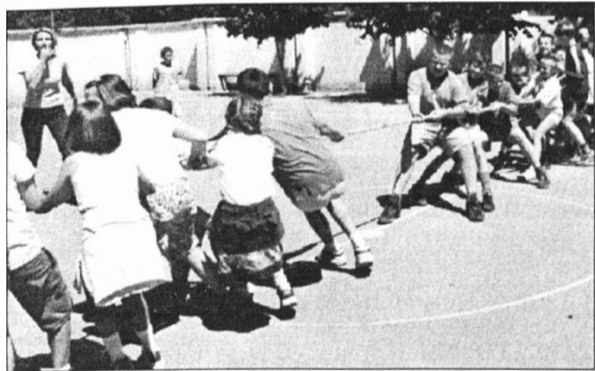
Az iskolák is kitétek magukért; képünk a Karácsonyi általános iskolában készült