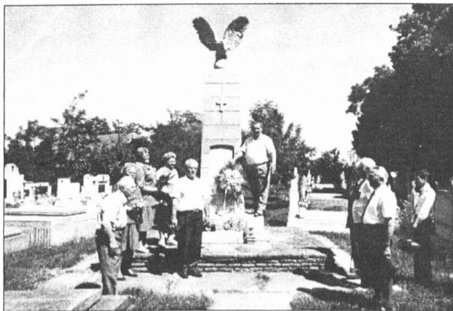
A németvárosi ótemető világháborús emlékműve előtt is tisztelegtek az egyesület tagjai

Némi elégtételt jelent az özvegyeknek, a világháborúkat túlélőknek és amiatt szenvedő hozzátartozóknak, hogy immár bő egy évtizede legalább meg lehet emlékezni ezen a májusi utolsó vasárnapon, amelyet (ismét) a Hősök napjának neveznek. A Gyulai Hadigondozottak Érdekvédelmi Egyesülete makacs és tisztelettel érdemlő elszántással szervezte meg az ideai koszorúzó szertartását is. Felekezettől, minden más ideológiai sallangtól is mentesen. Aggastyánok és matrónák, alig többen a krisztusi tanítványok számánál, néhány autóból ülvé járták végig ezen a kánikulás vasárnapon a temetőket. Elhelyezve azokat a műanyag koszorúkat, amelyeket kedvemenyvel vásároltak meg az egyik gyulai virágüzletben.