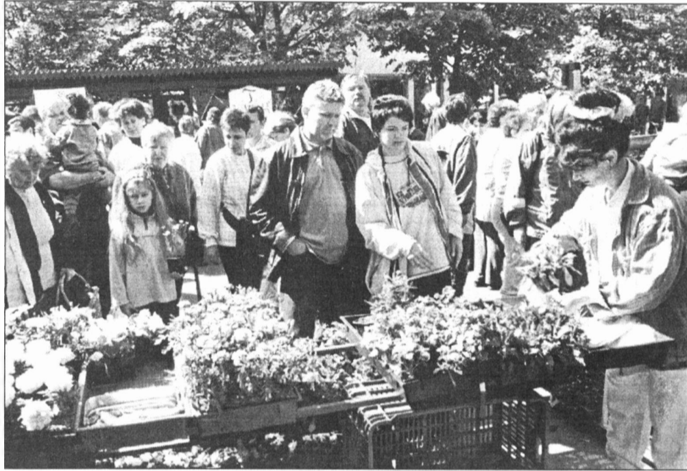
Igen sok érdeklődőt vonzott a Gyulai virágok vasárnapja, melyet első ízben rendeztek meg városunkban. Az eseményről szóló tudósításunk a 4. oldalon olvasható

A Galbácskerti Óvodában immár hagyomány, hogy az apukákra is gondolnak, s most már negyedik alkalommal rendeztek Apa-napot. (5. oldal)