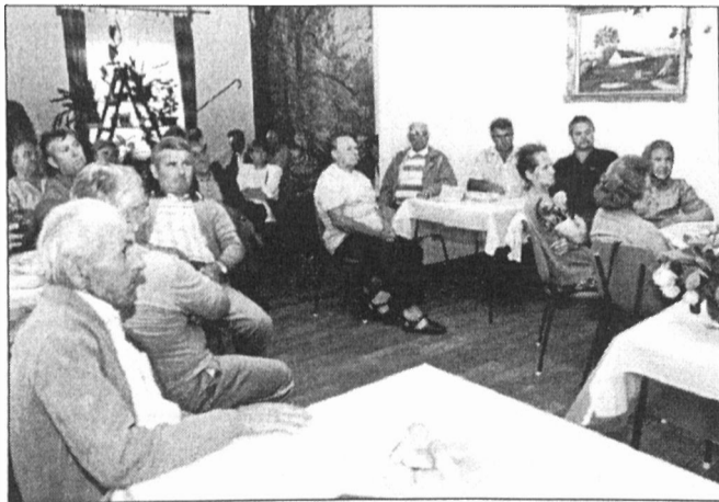
A magyarvárosi lakossági fórumon szinte minden résztvevő el is mondta véleményét