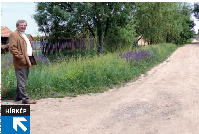
FOTÓ ÉS SZÖVEG: HARGITAI ÉVA