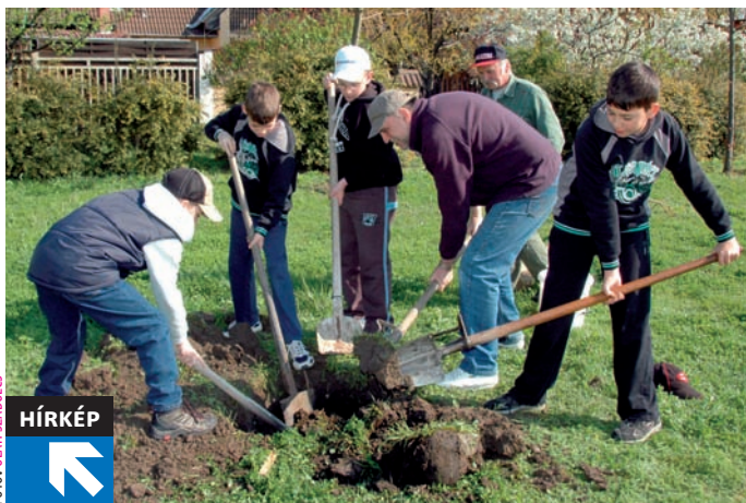
FOTÓ: OLÁH SZABOLCS