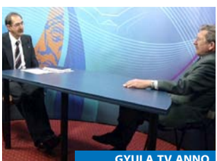
GYULA TV ANNO