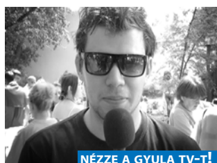
NÉZZE A GYULA TV-T!

10 hónapja látható a képernyőn életmódmagazin