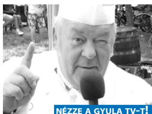
NÉZZE A GYULA TV-T!