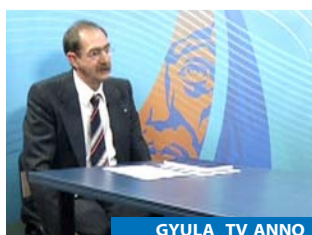
GYULA TV ANNO